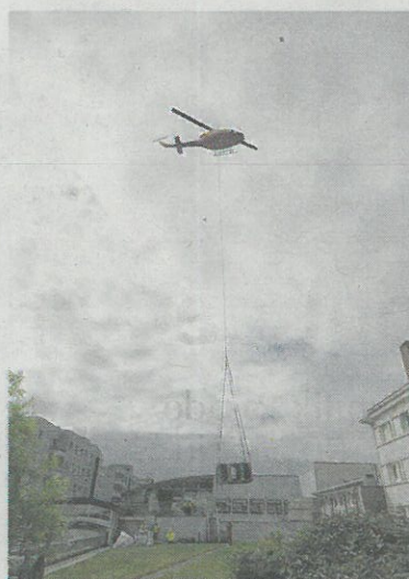
Une livraison millimétrée