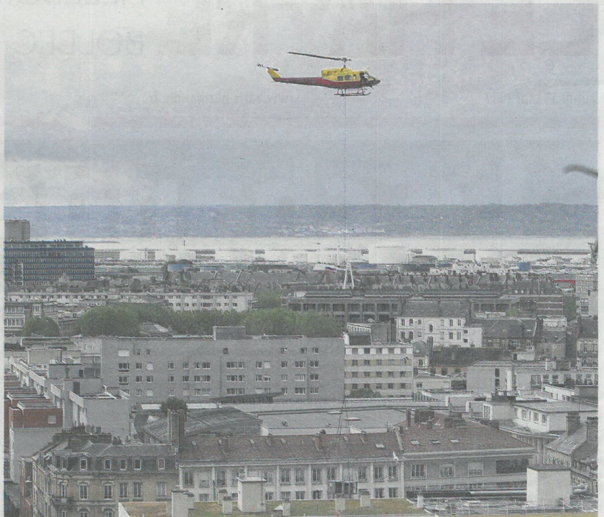
A 10 h, hier, première rotation de l'hélicoptère au-dessus du centre commercial. Les nouveaux équipements livrés ce dimanche répondent aux dernières normes environnementales internationales